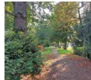
der Altstadt. Heute als Wallanlage bezeichnet, ist die seit dem 17. Jahrhundert mit Eichen bewachsene Befestigung in Teilen erhalten geblieben.

Während der Hildesheimer Stiftsfehde wurde Wittingen 1519 von Landsknechts-Heeren überrannt und geplündert. Die Wittinger Bürger erbaten sich daraufhin von ihrem Landesherrn, dem Welfenherzog, die Genehmigung für eine Befestigungsanlage. So entstand ein Doppelgraben an der Südseite