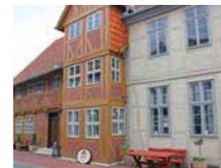
Die spätere Erweiterung erfolgte in Stockwerkbauweise, vermutlich im frühen und späten 19. Jahrhundert. Im Giebel sieht man ein mehrschichtig farbig gefasstes Schriftband. Schnitzereien rahmen die Eingangstür und zeigen das Wappen Kreyenbergs sowie die Jahreszahl 1640. Es findet sich ein großer Teil der originalen Ausstattung, die teilweise bis in das 17. Jahrhundert zurückreicht, wie etwa die Beschläge. Au-

Das Haus Kreyenberg ist eines der ältesten Gebäude Wittingens. Es wurde nach einem Stadtbrand 1640 am heutigen Standort wiedererrichtet und 1720/40 sowie 1850 erweitert. Das Haus diente lange als Brau- und Wirtshaus. Nach einer Zeit des drohenden Verfalls wurde das historische Gebäude aufwendig saniert (2014–2016). Bei dem Bau handelt es sich um einen zweigeschossigen Fachwerkbau, der in seiner ältesten Bausubstanz zur Rückseite in Ständerbauweise mit Ankerbalken ausgeführt wurde.