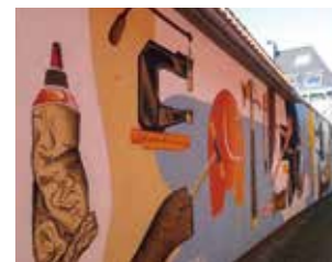
der Künstler das historische Schusterhandwerk. Weitere Kunstwerke sind zu sehen in der Bahnhofstraße und im Freibad.

In der Altstadt befinden sich zwei großflächige Graffiti, die vom Künstler Marius Förster geschaffen wurden. Am westlichen Eingang zur Altstadt ist das Projekt „Europa“ zu sehen, in welchem er einen kritischen Blick auf das europäische Zeitgeschehen wirft. Ein weiteres Werk befindet sich in der Schuster-gasse (Ecke Lange Straße). Hier thematisiert