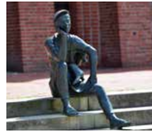
Einkommensquelle der Stadt war. Das eher ländlich geprägte Umfeld der Stadt Wittingen stellte die Lieferung der Hauptkomponente Leder sicher. Die meisten Schuhmacher befanden sich in der Achterstraße.

Alle Bronzefiguren auf dem Marktplatz wurden vom Bildhauer Georg Arfmann geschaffen. Ermöglicht wurde dies durch eine Initiative von Bürgern, Firmen und der Stadt Wittingen in den Jahren 1991 bis 1998. Die Statue des Schusterjungen soll daran erinnern, dass das Schusterhandwerk in Wittingen zu seiner Blütezeit mit etwa 60 Meisterbetrieben die größte