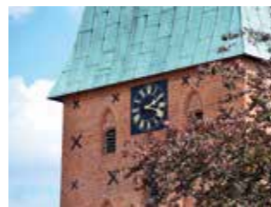
Brand im Jahre 1474 wiederaufgebaut wurde. Die außergewöhnliche Gestaltung und viele Exponate im

Die Kirche ist in ihrer heutigen Form eine Basilika aus der Zeit um 1250 (Backsteinromanik). Chor (jetzige Taufkapelle), Turm und Fensterbögen sind der Gotik zuzuordnen, da die Kirche nach einem