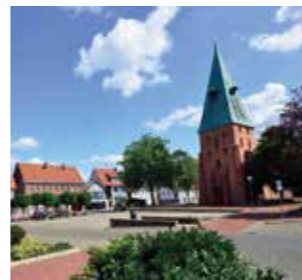
Marktplatz bilden ein Bronzefiguren-Ensemble.

Der Wittinger Marktplatz befindet sich im Zentrum der Altstadt. Der „Schusterjunge“ auf den Treppen vor dem Kirchturm der St.-Stephanus-Kirche, die „Ackerbürger“ und der „Bierbrauer“ auf dem