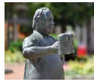
ihre Braurechte und zeugt davon, dass das Bierbrauen in Wittingen seit jeher eine wichtige Einnahmequelle ist.

In unmittelbarer Nähe zum alten Stammhaus der Wittinger Brauerei (Haus Stackmann, Lange Straße 35) steht die Bronzefigur des Bierbrauers als Zeichen für die damalige und heutige Bedeutung des Bierbrauens in der Stadt. Die Brauerei erhielt bereits 1429